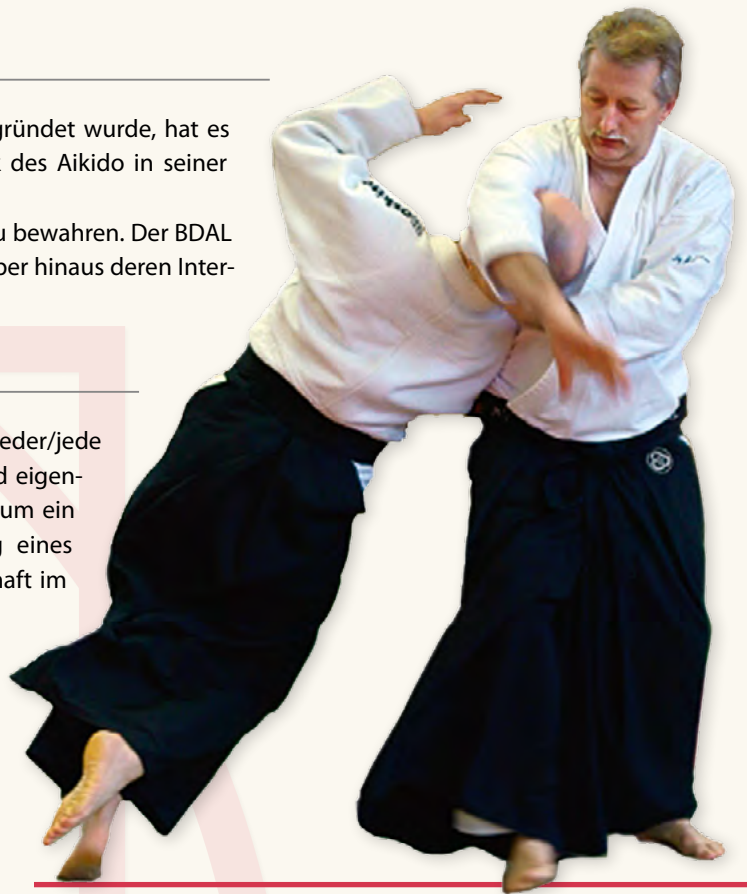
Aikido in Perfektion zeichnet sich durch das ungehinderte Fließen der Kraft aus – Einklang von Körper und Geist.

Alle Mitglieder des Verbandes haben die Gelegenheit, an speziellen Lehrgängen zur Fortbildung teilzunehmen. Überdies unterstützt der Verband die Mitglieder bei der Organisation von Lehrgängen im eigenen Dojo. Die Dojo- und Unterrichtsleiter können auch bei allen anderen Fragen jederzeit mit der Hilfe des Verbandes rechnen.